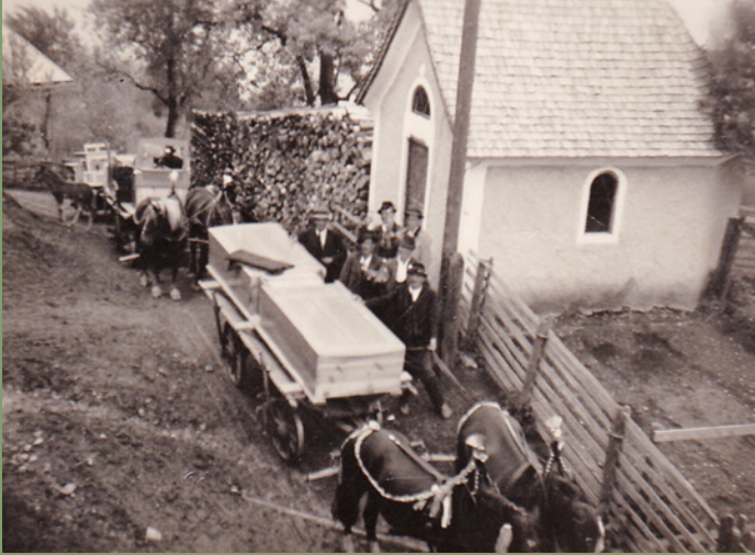
„Watzum führen“ (ein alter Hochzeitsbrauch, feierlicher Transport aus Aussteuer der Braut vom elterlichen Haus in das neue Zuhause) im Bereich der Grillkapelle, 1948