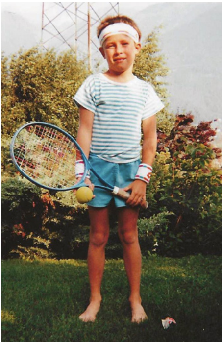
Die Liebe zum Tennis begann bereits im Kindesalter.

Angefangen hat alles während meines Studiums, als ich am Weerberg und auch in Vomp als Tennistrainer gearbeitet habe, um mir etwas dazuzuverdienen. Insgesamt habe ich etwa drei Jahre lang als Trainer gearbeitet und