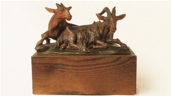
„Goaßpaar!“ von Franz Viertl, entstanden ca. 1950

Die Vernissage zur Ausstellung, die bis 27. September 2026 in der Veranda des Rablhauses gezeigt wird, findet am 24. Juli 2026, um 18:00 Uhr statt. Dabei wird auch die Tochter des Künstlers anwesend sein.