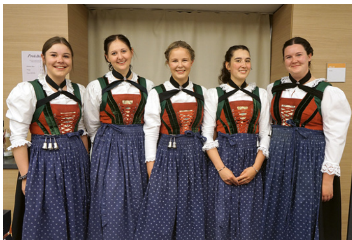
Auch unsere Marketenderinnen trugen zum gelungenen Konzertabend bei.