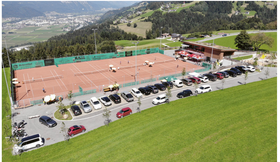
Die neue Freizeit- und Sportanlage Weerberg aus der Vogelperspektive.