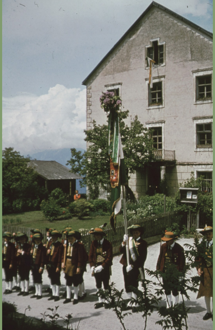
Schützen vor dem Widum, um 1965