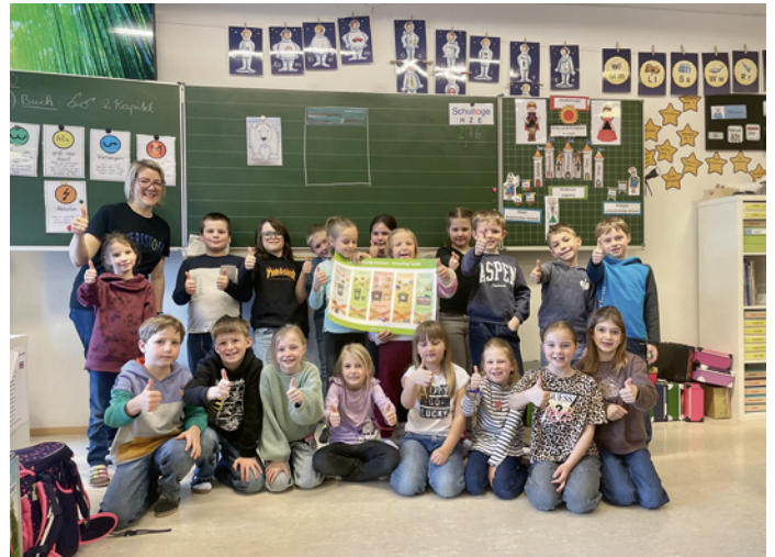
Der Workshop vermittelte den SchülerInnen spielerisch die Bedeutung von Abfalltrennung und -vermeidung – ein wertvoller Beitrag für die Gemeinde.

Mit einer spannenden Geschichte nahm sie die SchülerInnen mit an einen Ort, an dem Abfall nicht getrennt wird und alles auf einem großen Müllberg landet. Gemeinsam mit dem Maskottchen Alfons Trennfix wurde dann sortiert, ausprobiert und gestaunt. Spielerisch lernten die Kinder, wie Abfall richtig getrennt wird, warum Abfallvermeidung wichtig ist und wie Recycling unsere Umwelt schützt. So wurde schnell klar: Abfalltrennung ist kinderleicht und ein wichtiger Beitrag für unsere Gemeinde.