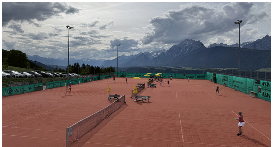
Die vier Tennisplätze bieten perfekte Bedingungen, selbst bei widrigen Wetterverhältnissen.