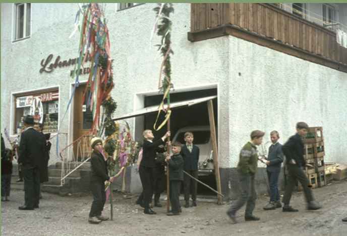
Palmtragen vor dem ehemaligen Lebensmittelgeschäft Gredler, heute EZEB