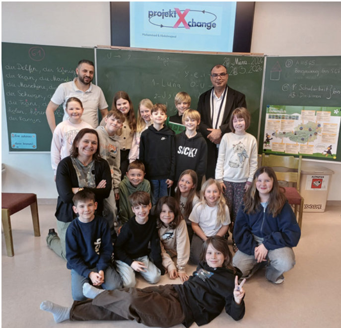
Begegnung zwischen Schulkindern, Lehrerin und zwei Männern aus Syrien im Rahmen des Projekts „Exchange“.

Foto und Text: Volksschule Mitterweerberg