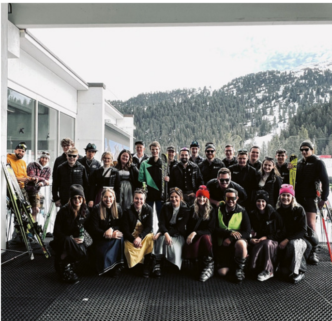
Perfekt gestylt fürs Wedelfinale

Am 11. April 2026 machten wir uns gemeinsam mit unseren Mitgliedern auf den Weg nach Zell am Ziller, um das Wedelfinale zu besuchen.