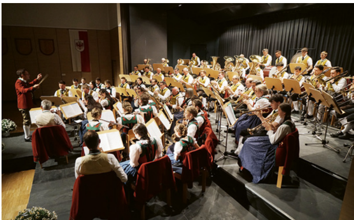
Voller Einsatz und große Spielfreude auf der Bühne im Centrum Weerberg

Am Freitag, 8. Mai lud die Bundemusikkapelle Weerberg zum diesjährigen Frühjahrskonzert ins Centrum Weerberg ein. Unter dem Motto „Liebe“ präsentierten die Musikantinnen und Musikanten ein abwechslungsreiches und emotionales Programm, das das Publikum von der ersten bis zur letzten Minute fesselte.