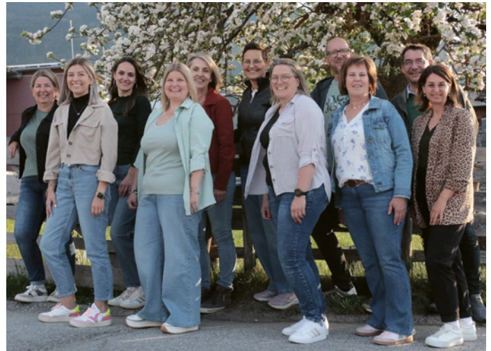
Ausschuss des neu gegründeten Vereins