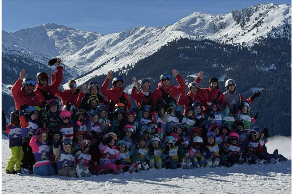
Der Skikurs war ein voller Erfolg und ein unvergessliches Erlebnis für die Kinder!

Ende Februar organisierten engagierte Eltern über den Familienverband Weerberg einen Skikurs für die Kindergartenkinder. Insgesamt waren 53 Kinder mit viel Begeisterung und Freude dabei. Ein herzlicher Dank gilt den zahlreichen Eltern sowie den Pädagoginnen des Kindergartens, die als Begleitpersonen dabei waren und die Kinder auch beim Liftfahren tatkräftig unterstützt haben. Ein besonderer Dank geht an die Skischule Silversport für die hervorragende Zusammenarbeit und die super Durchführung des Kurses sowie an die Sponsoren: Raiffeisen Regionalbank Achensee, Fliesenpark Mils, ASW Installationstechnik, Smooth-Move Jars, Hochschwarzer und Knapp, Holzbau Heim, Elektro Knapp, Technik und Design ERLER und Carendl Cut, die uns den Bus für die gesamte Woche finanziert haben! Am Freitag erhielten die Kinder noch eine Jause und die Brezen wurden vom Gasthaus Hüttegg zur Verfügung gestellt – vielen Dank dafür!