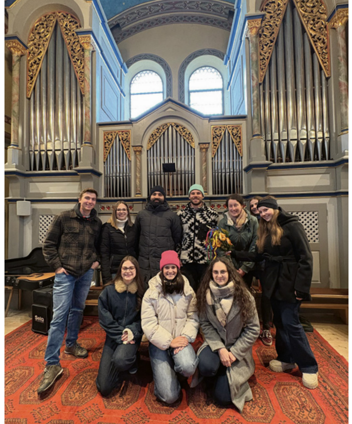
Der Chor Amicelli beim Auftritt am Palmsonntag.