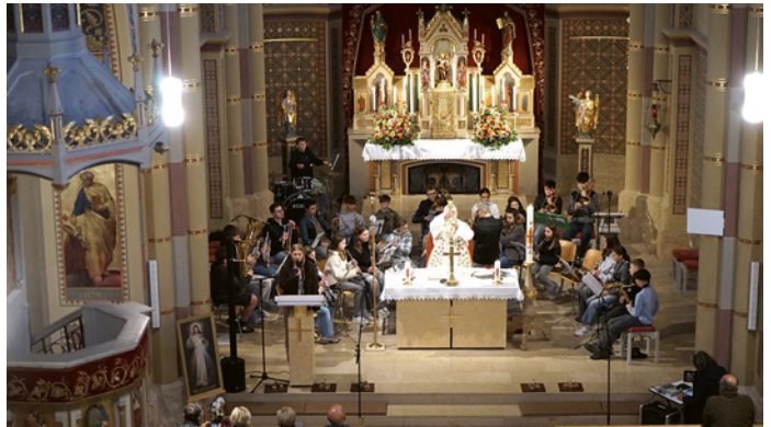
Ein besonderer musikalischer Abend für die Youngsters der BMK Weerberg

Mit großem Applaus dankte das Publikum den Musikantinnen und Musikanten für einen gelungenen Konzertabend, der ganz im Zeichen der Liebe stand und viele Emotionen weckte. Die BMK Weerberg freut sich bereits jetzt, ihr Publikum bei den kommenden Konzerten wieder begrüßen zu dürfen.