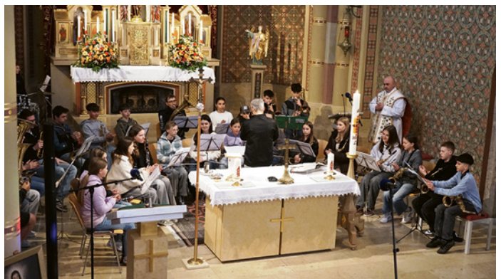
Gelungener Auftritt der Youngsters der BMK Weerberg bei der Liveübertragung über Radio Maria Österreich