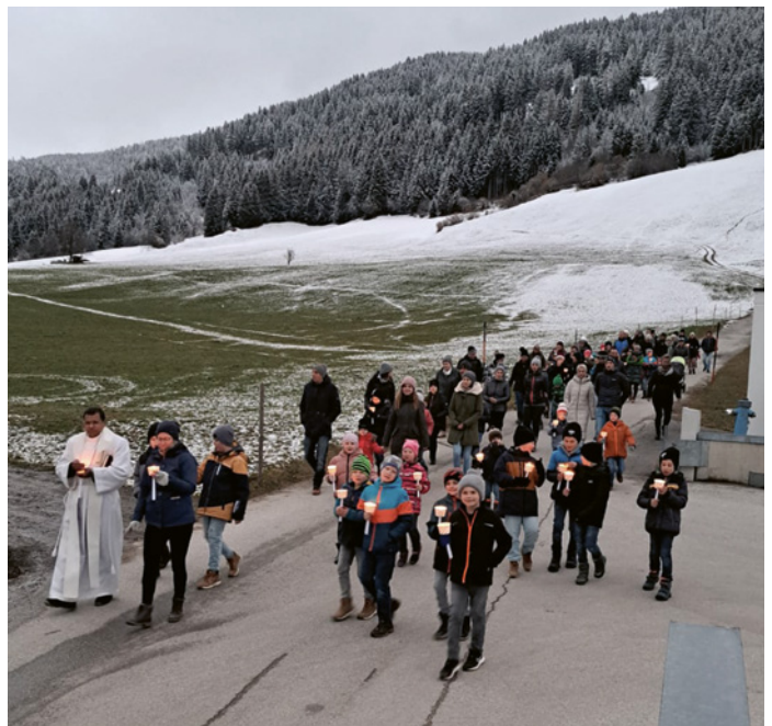
Lichterwanderung entlang des Wiesenhofwegs