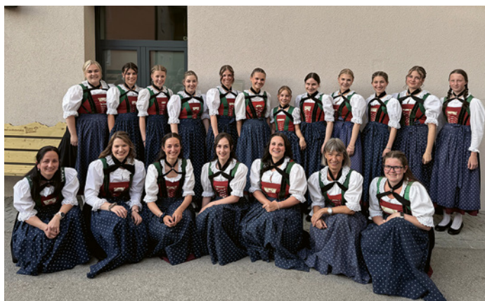
Die Musikantinnen der BMK Weerberg

Die Live-Übertragung über Radio Maria Österreich machte diesen Auftritt zu einer besonderen Erfahrung für die Youngsters und bot gleichzeitig eine schöne Möglichkeit, ihr Können einem breiten Publikum zu präsentieren. Die durchwegs positiven Rückmeldungen bestätigen den gelungenen musikalischen Beitrag.