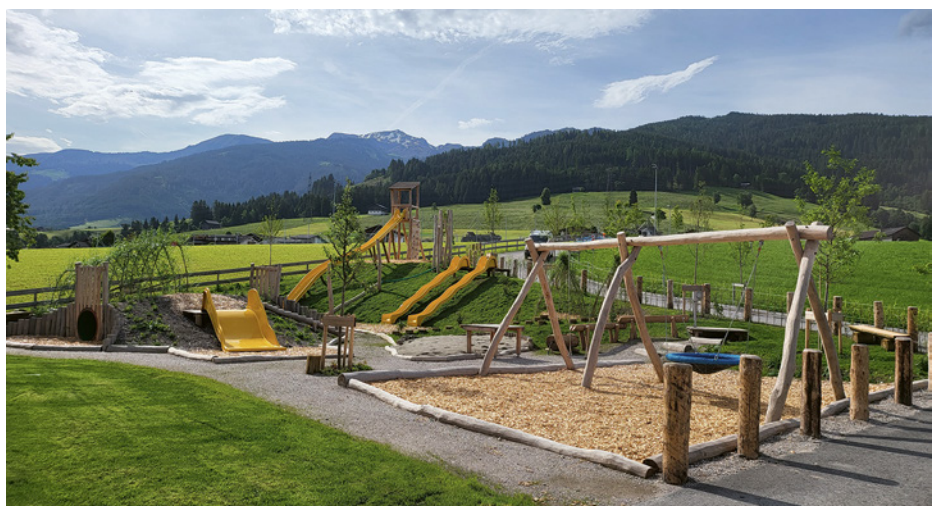
Der öffentliche Spielplatz, ein Treffpunkt für Kinder und Familien.