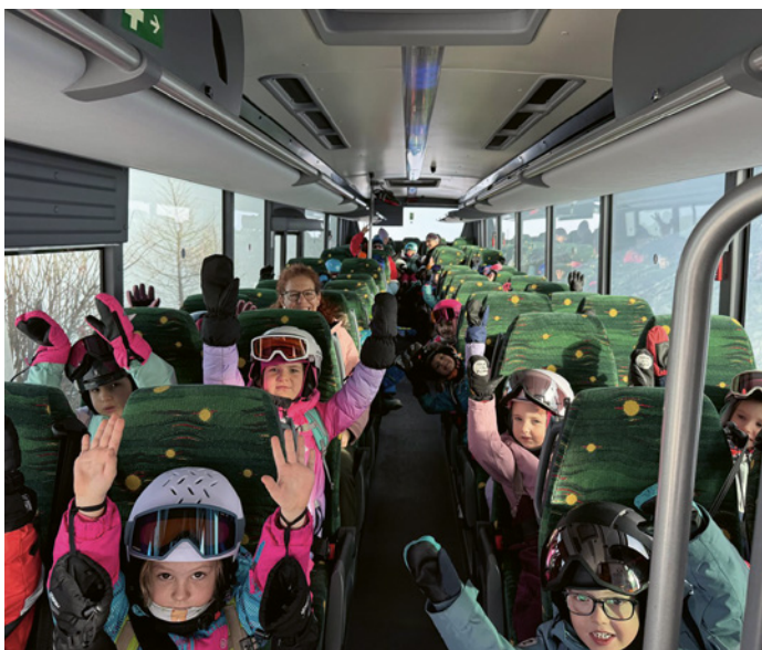
Ein Bus konnte nur dank großzügiger Spenden organisiert werden.

Der Katholische Familienverband ist ein in Tirol bzw. österreichweit tätiger Dachverband mit zahlreichen Zweigstellen in den Gemeinden. Er vertritt die Interessen von Familien in Politik und Gesellschaft und fungiert zugleich als wichtige Service- und Anlaufstelle für Familien.